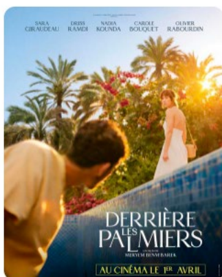
Derrière les palmiers_4-... 538.70 KB - jpg

https://pyramide-international.filemail.com/d/oaawleclzlyxsxf